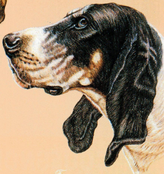
Français Blanc et Noir