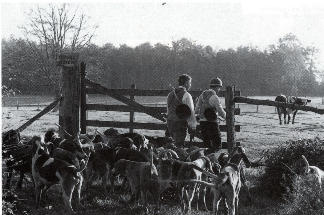
En Normandie : défaut dans les prairies.

Le chenil est situé dans la propriété de Frédebise à Lonlay-l'Abbaye, dans l'Orne.