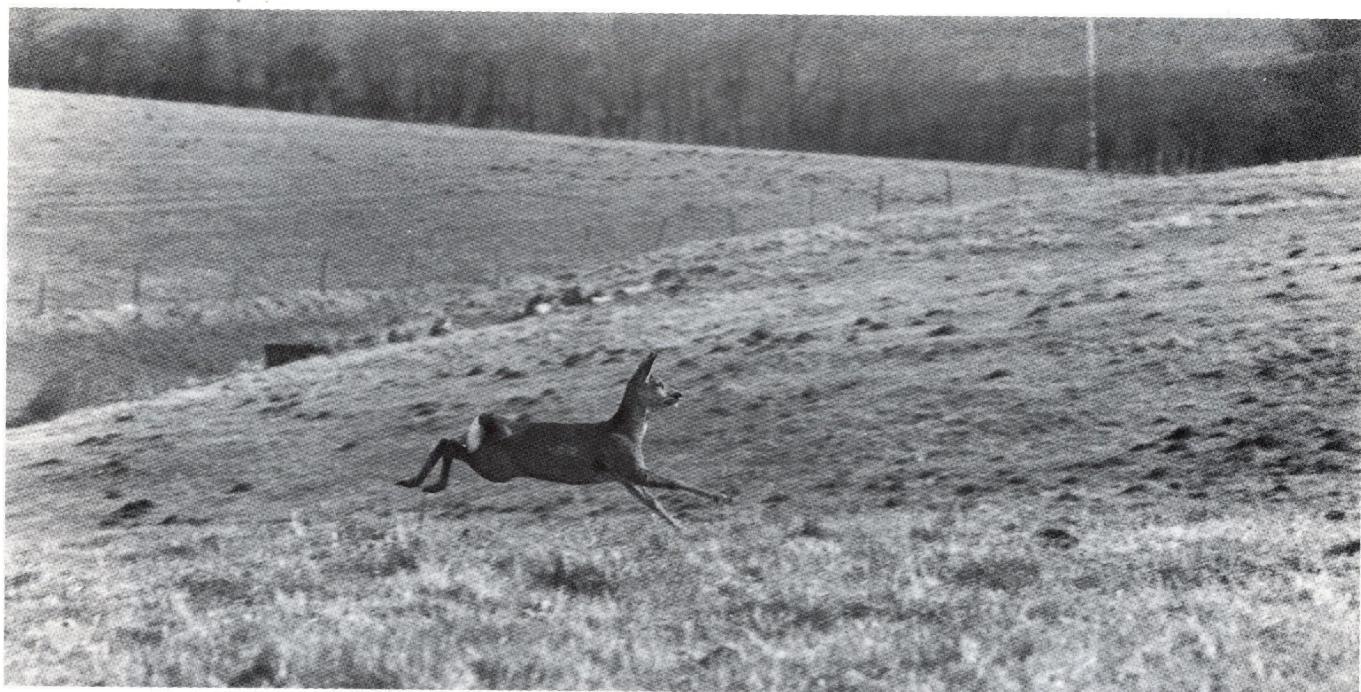
Débuché à Dieufit (Orne).