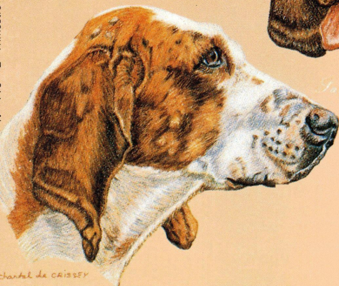
Charbel de CRISSEY